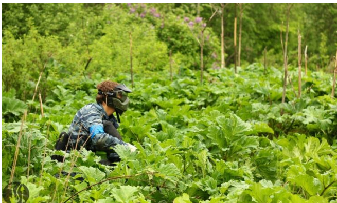
ежемесячник от ПК «Аркуда»

Следующая моя битва была левее от предыдущего места. Это было поле с высокой травой, большими «лопухами» и небольшими